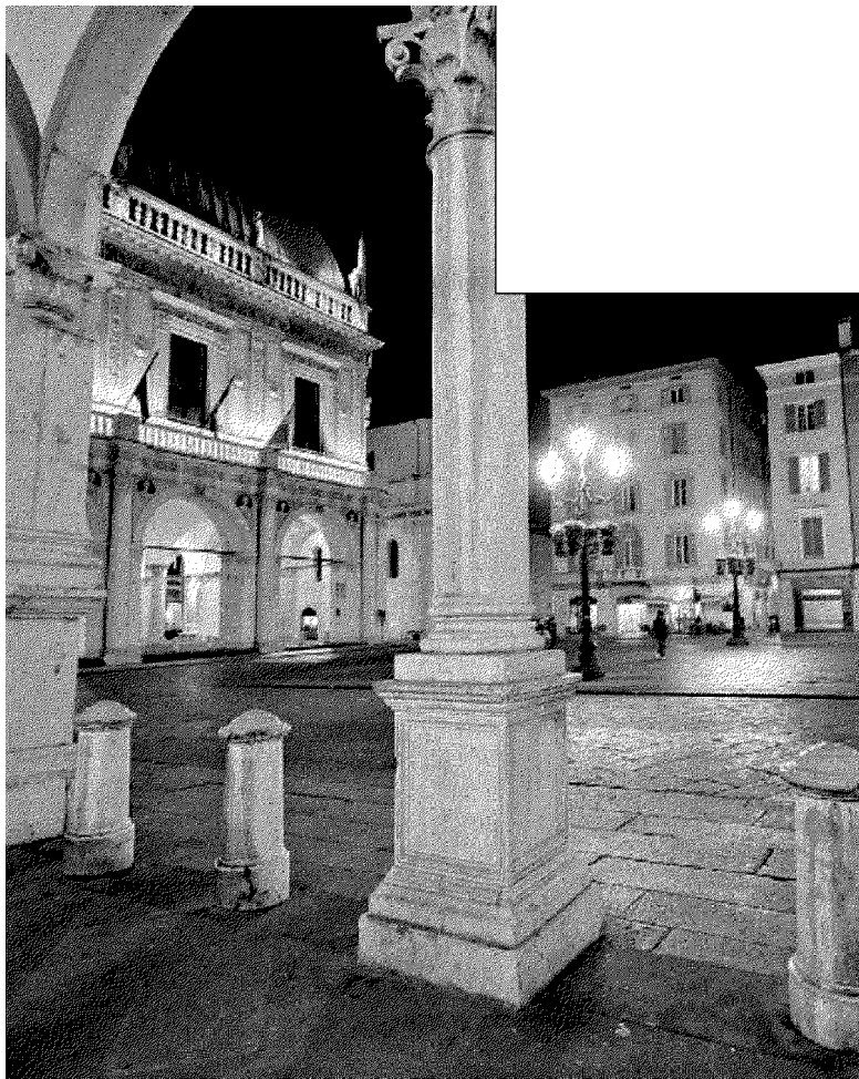
Lungo vertice ieri sera a Palazzo Loggia sul nodo commercio e Pgt